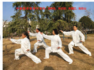
中国南京鼓楼区武协代表队