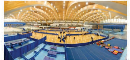
列治文奥林匹克运动场