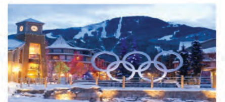
冬奥滑雪胜地威士拿

早餐后7:30AM乘車出發，途經獅門大橋前往太平洋沿岸之著名風景道『海連天公路』(SEA TO SKY HIGHWAY)，欣賞 馬蹄灣，布勒內海及寶雲群島的秀麗景色。